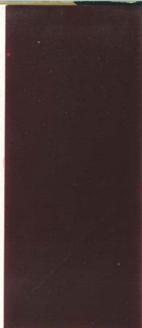
6808 Burgundrot Burgundy red rouge Bourgogne rosso Borgogna