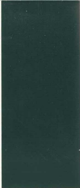
6801 Schiefergrau slate grey gris ardoise grigio ardesia