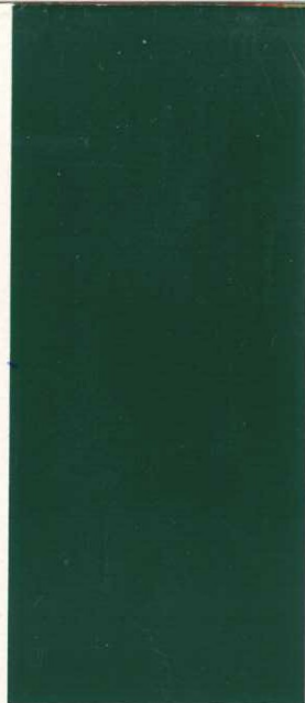
6806 Irischgrün Irish green vert Irlande verde Irlanda