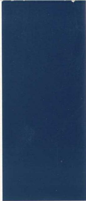
6803 Ossiblau ossi blue bleu ossi blu ossi